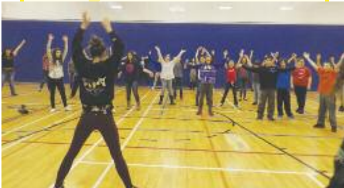
Les élèves de la PAJS en action.